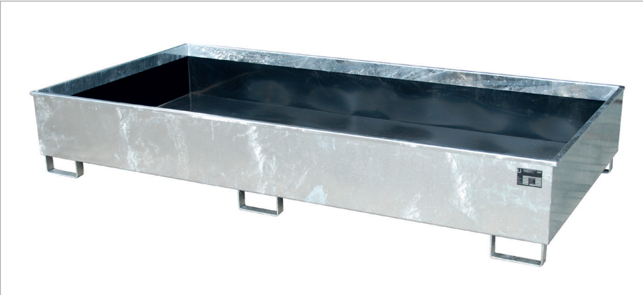
RW 2700-3 PE