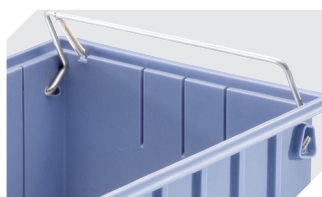
Sicherungs-/Tragebügel für Regalkästen RK und C-Teile-Behälter CTB 3-31314