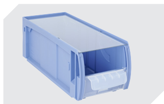
Staubdeckel CSD für C-Teile-Behälter CTB L 369 x B 148 mm 53-31342