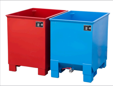
C 30 und CS 30