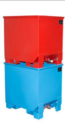
CS 30 gestapelt