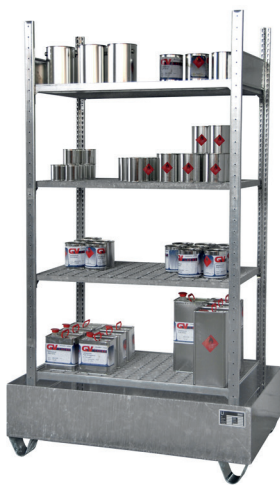
Grundregal S 3021-4E