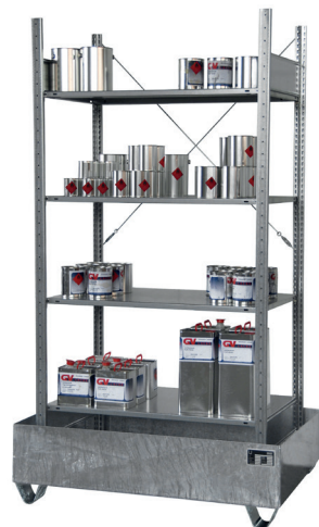
Grundregal S 3022-4E