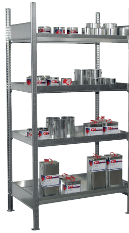
Grundregal S 3019-4E