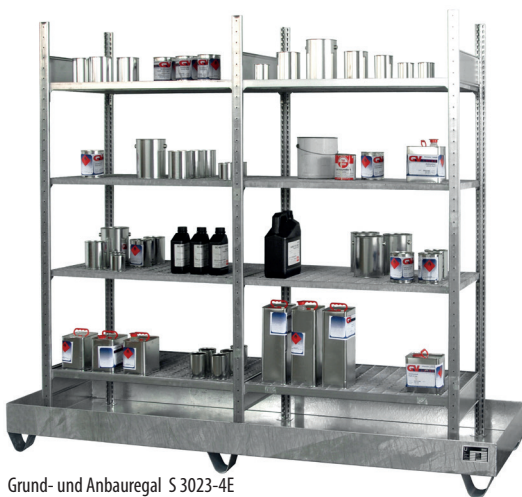
Grund- und Anbauregal S 3023-4E