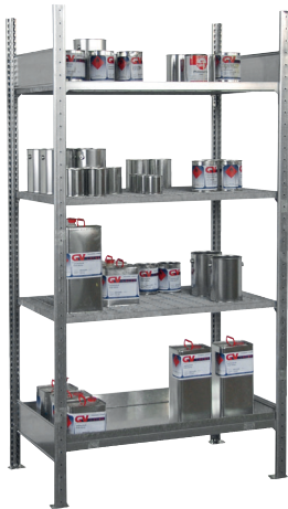
Grundregal S 3017-4E