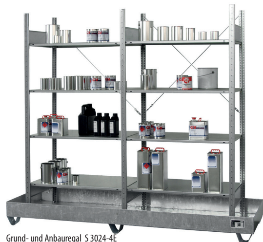
Grund- und Anbauregal S 3024-4E