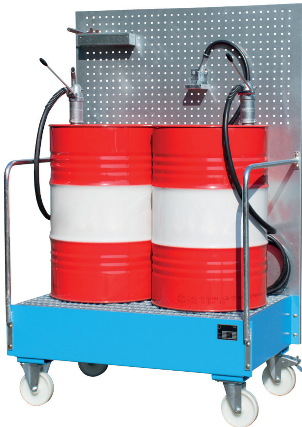
LPW 200-2 mit Werkzeugablage und Tropfwanne (Zubehör)

Mobiles, sicheres und einfaches Abfüllen von Ölen etc. an verschiedenen Verbrauchsstellen aus 200-l-Fässern