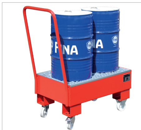
AW 60-1 SR