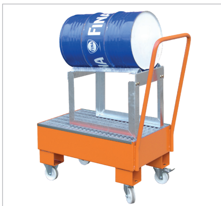
AW 60-1 SRF