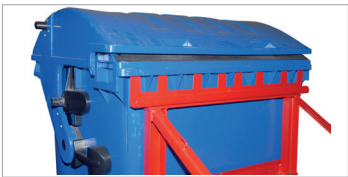
MH-II mit 1100-l-MGB